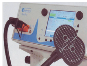
反復性経頭蓋磁気刺激装置