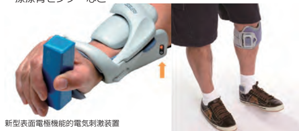
新型表面電極機能的電気刺激装置