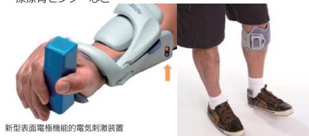
新型表面電極機能的電気刺激装置