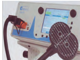
反復性経頭蓋磁気刺激装置