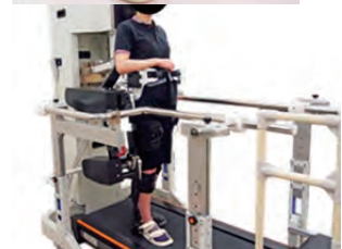
開発中のリハビリテーションロボット AkitaTrainer